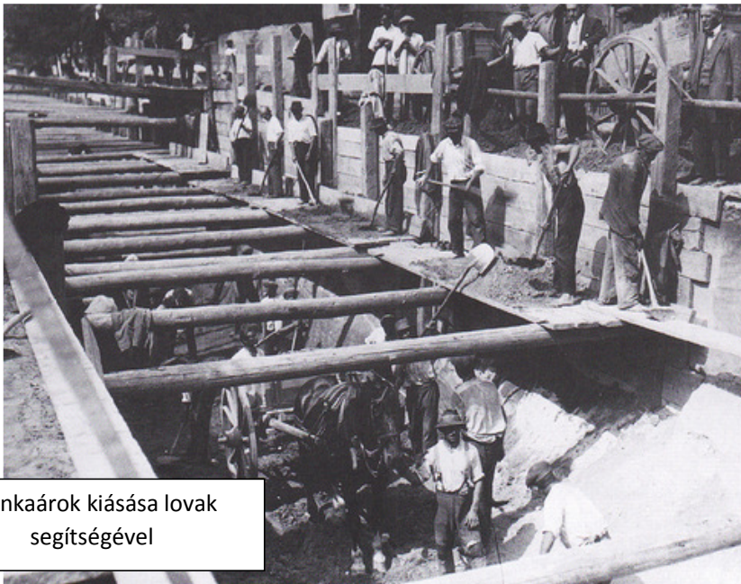
Munkaárok kiásása lovak segítségével