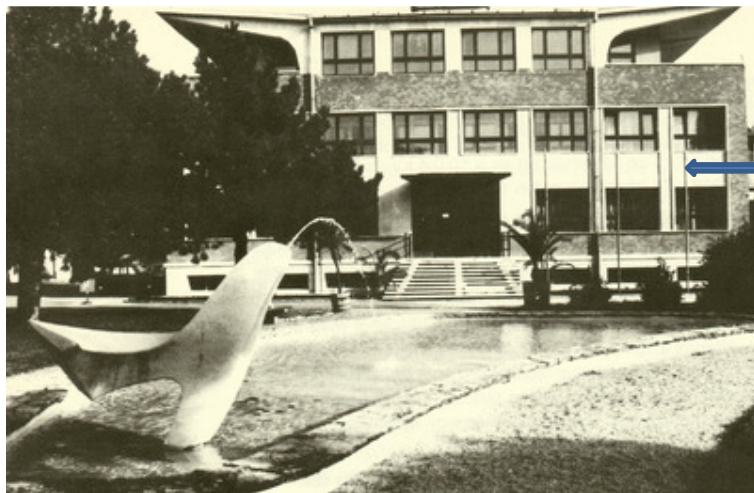
A víztisztítómű központi épülete