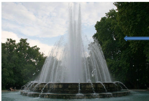
1962-ben felavatták az ország legnagyobb szökőkútját a budapesti Margitszigeten.

A látványos alkotás létrejöttéhez a Fővárosi Vízművek dolgozói jelentős hétvégenkénti önkéntes munkával járultak hozzá.