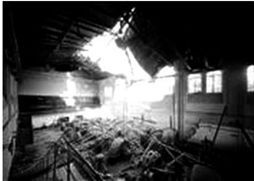
A Soroksári úti szivattyútelep gépháza egy bombatámadás után

A második világháború bombázásai és az ostrom következtében a csatornahálózat 153 helyen, 3360 méter hosszban sérült. A központi szivattyútelepet Ferencvárosban 32 bombatalálat érte. Az óbudai szivattyútelep gépháza teljesen víz alá került. A sérülések következtében a csatornáknak mintegy 24 000 m 3 iszap rakódott le, és kb. 105 km hosszban megbénult a szennyvízelvezető-hálózat működése. Két év alatt, 1947-re megfeszített munkával sikerült a károk helyreállítása.