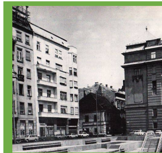
A Fővárosi Csatornázási Művek első, központi irodaháza Budapest Belvárosában, a Március 15-e téren

az FCSM első vezérigazgatója, későbbi főmérnöke