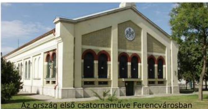
Az ország első csatornamúve Ferencvárosban