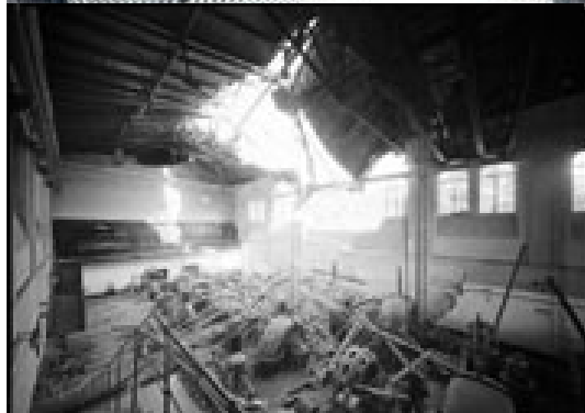
1944-45-ben 32 bombatalálat érte a központi szivattyútelepet Ferencvárosban

A rendelet alapján azonnal megkezdődött a nagyvállalat szervezése, létrehozása. A székesfőváros törvényhatósági bizottsága 1945. augusztus 8-án már megtárgyalta a polgármester részletes előterjesztését melyet ezzel indított: