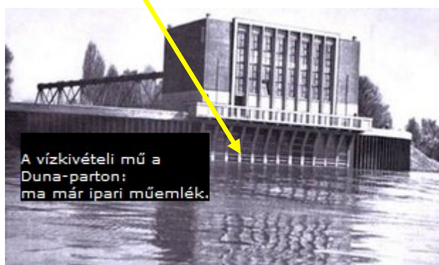
A vízkivételi mű a Duna-parton: ma már ipari műemlék.