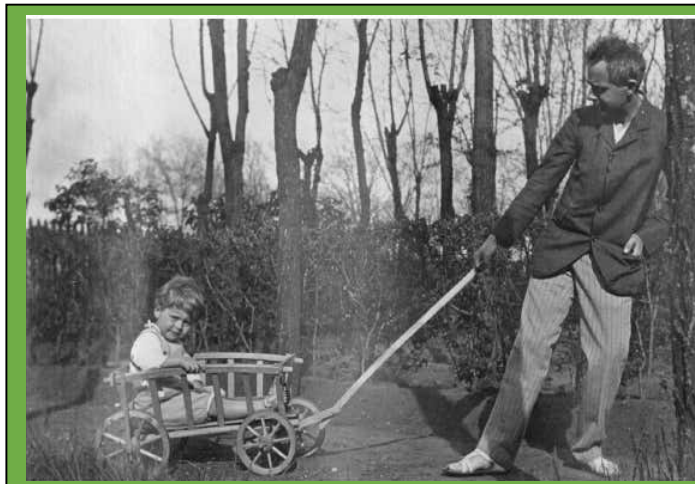
A zeneszerző a képen fiával, ifjabb Bartók Bélával látható házuk kertjében.

Bartók Béla világhírű zeneszerzőnk fiatal házasként 1911-ben érkezett családjával ide. Először bérelt lakásban éltek, majd 1912-ben költöztek a Zsófiatelepi Hunyadi utca 50 sz. alatt felépült házukba. Több híres művét, így a Fából faragott királyfit is itt alkotta.