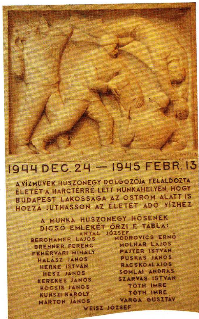
Emléktábla a bombázás áldozatairól

A vízszolgáltatás azonban az ostrom idején is biztosított volt. A pincékbe, óvóhelyekre kényszerült lakosság mindig hozzájutott a tiszta, egészséges ivóvízhez.