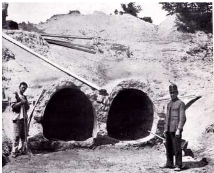
A káposztásmegyeri ikercsatorna, a törés utáni feltáráskor (1923)

A tényleges megoldást jelentő Kajlinger javaslatok megvalósulását egy katasztrófa, a káposztásmegyeri ikercsatorna törése segítette. Ekkor már nem spórolhattak a vízműfejlesztéseken a városatyák. Az akkor beindult megújulási munkákhoz a Speyer kölcsön nyújtott fedezetet. A 20 millió dolláros hitelből 14,4 millió dollár jutott a Fővárosi Vízművek létesítményeinek építésére, megújítására, korszerűsítésére, a gőzgépek villanyhajtású centrifugálszivattyúval történő cseréjére.