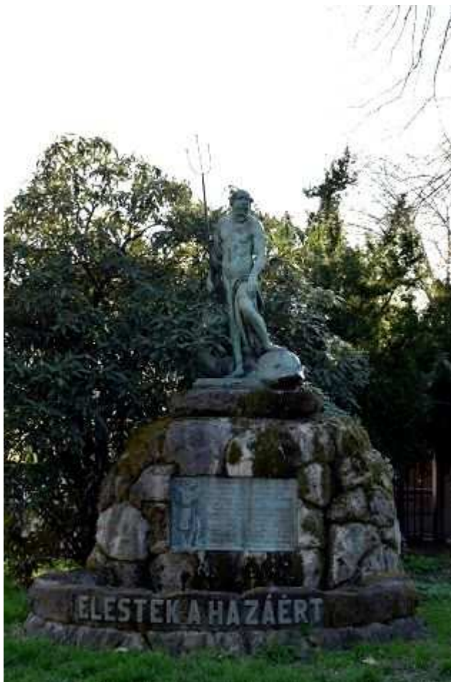
A Vízművektől behívott, csatákban elesettek emlékműve a Káposztásmegyeri Főtelep kertjében

Az 1900-as évek első évtizedére a világvárossá fejlődött Budapesten folyamatosan növekedett a vízigény, mellyel a vízmű fejlesztések többé-kevésbe igyekeztek lépést tartani. 1910 és 1917 között a főváros lakosainak száma jelentősen megemelkedett: 880 371-ről 991 725-re.