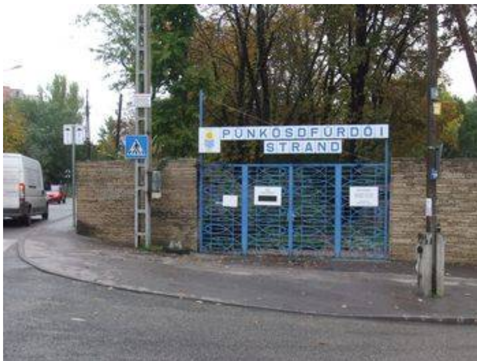
Ezt, a csak nyáron üzemelő strandfürdőt elsősorban a környék lakói látogatják, de barátságos árai és jó felszereltsége miatt sokan jönnek ide Pest-Buda más részeiből is.