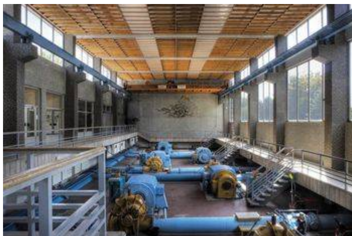
„Új” békásmegyeri gépház