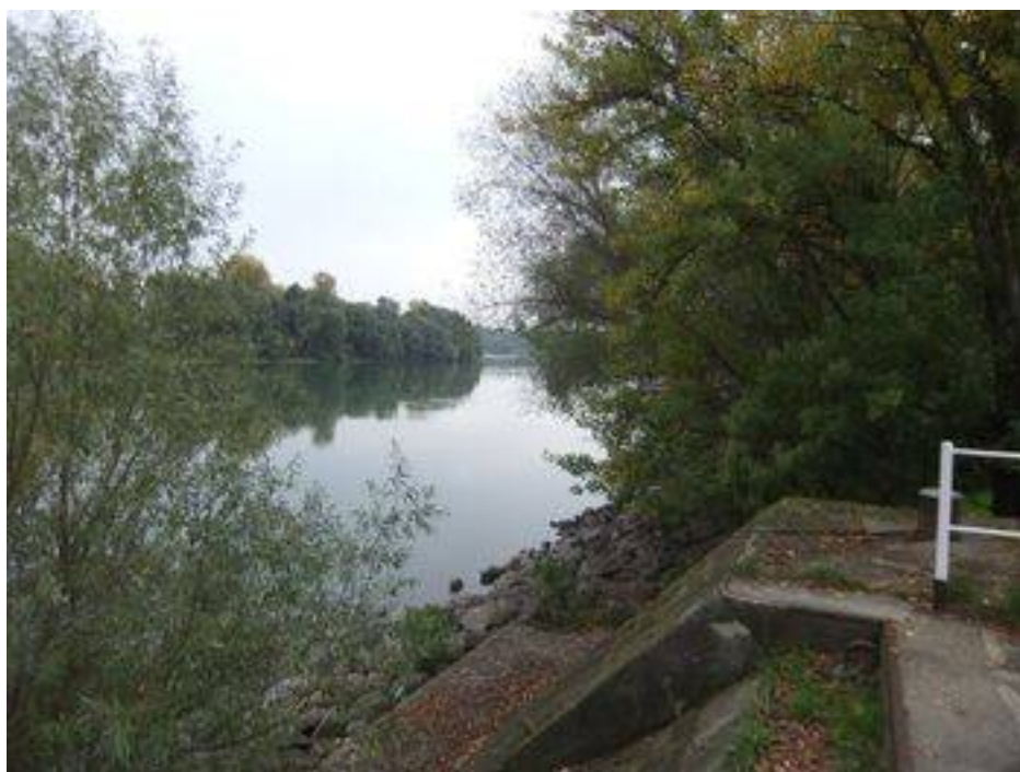
A BKK menetrendszerű hajóáratának Pünkösdfürdő-Békásmegyer végállomásán – mai sétánkon még egyszer – megcsodáljuk a nagy folyónk nyújtotta panorámát.