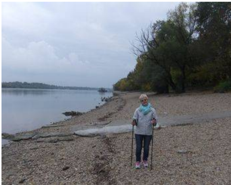
Egy kis szakaszon – alacsony vízállás esetén – kavicsos talajon is haladhatunk közvetlenül a Duna mellett.