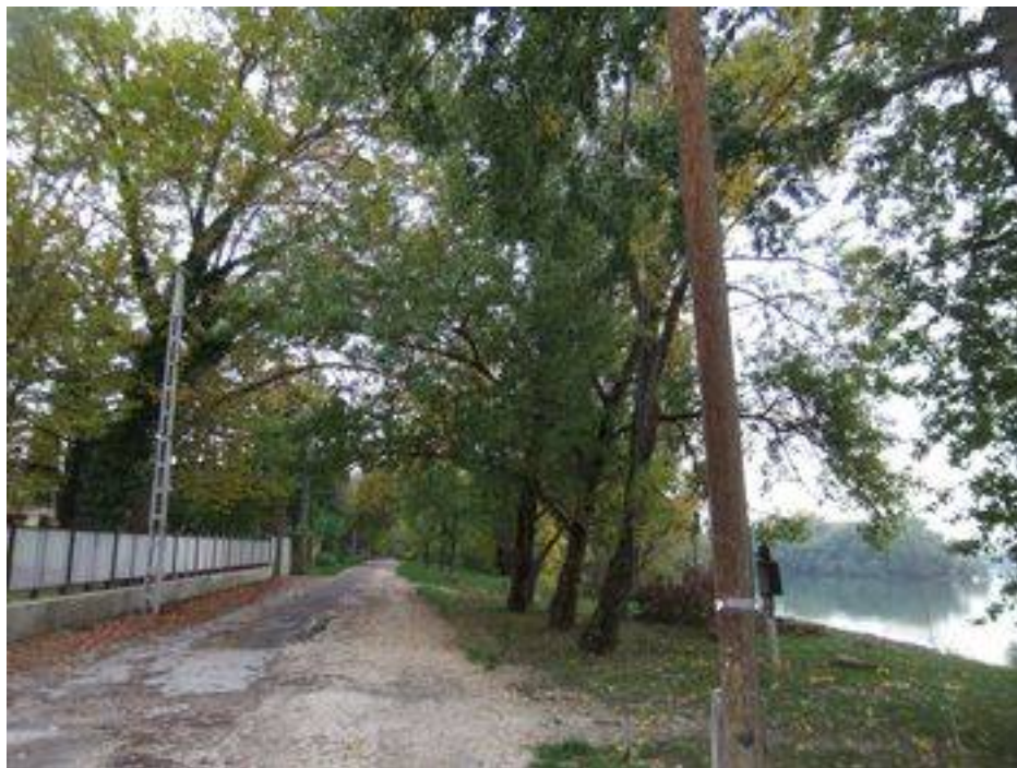
A Római partról a Kossuth Lajos üdülőparton folytatjuk sétánkat.