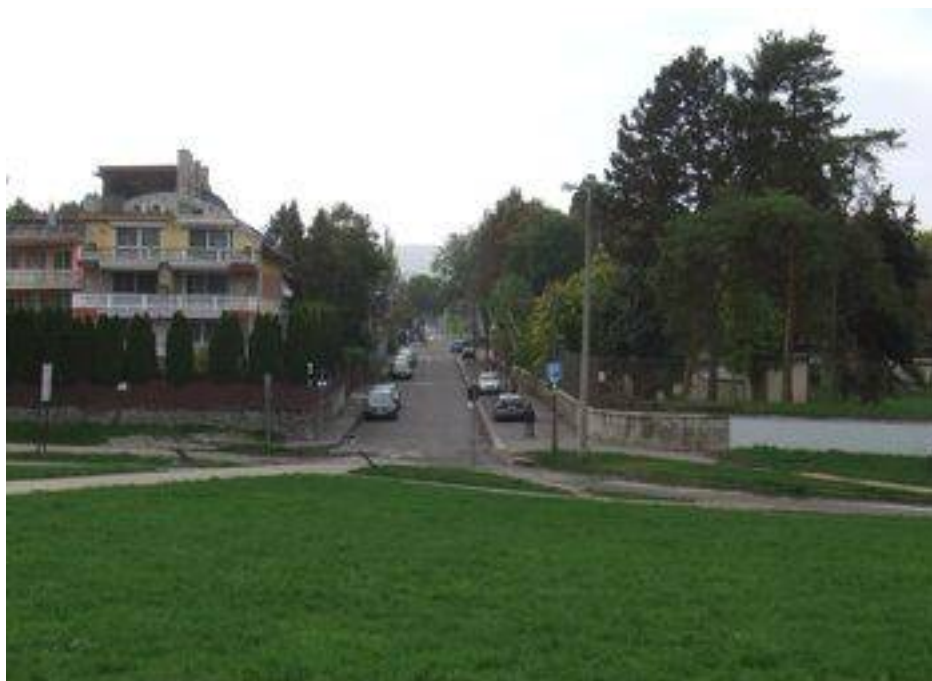
Visszatérünk a gát túloldalára, ahol az utcasaroktól már a Pünkösdfürdői Strand medencéit, vízi csúszdáit láthatjuk.